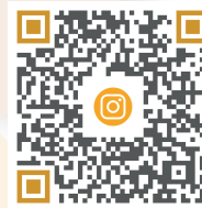
SAN CAYETANO EXPRESS

Para mayor información siguenos en nuestras redes sociales: