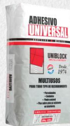
UNIVERSAL BLANCO 20KG