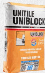
UNITILE BLANCO 20KG