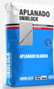
APLANADO BLANCO 40KG