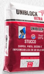
STUCCO ULTRA BLANCO 40KG