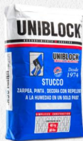
STUCCO EM BLANCO 40KG