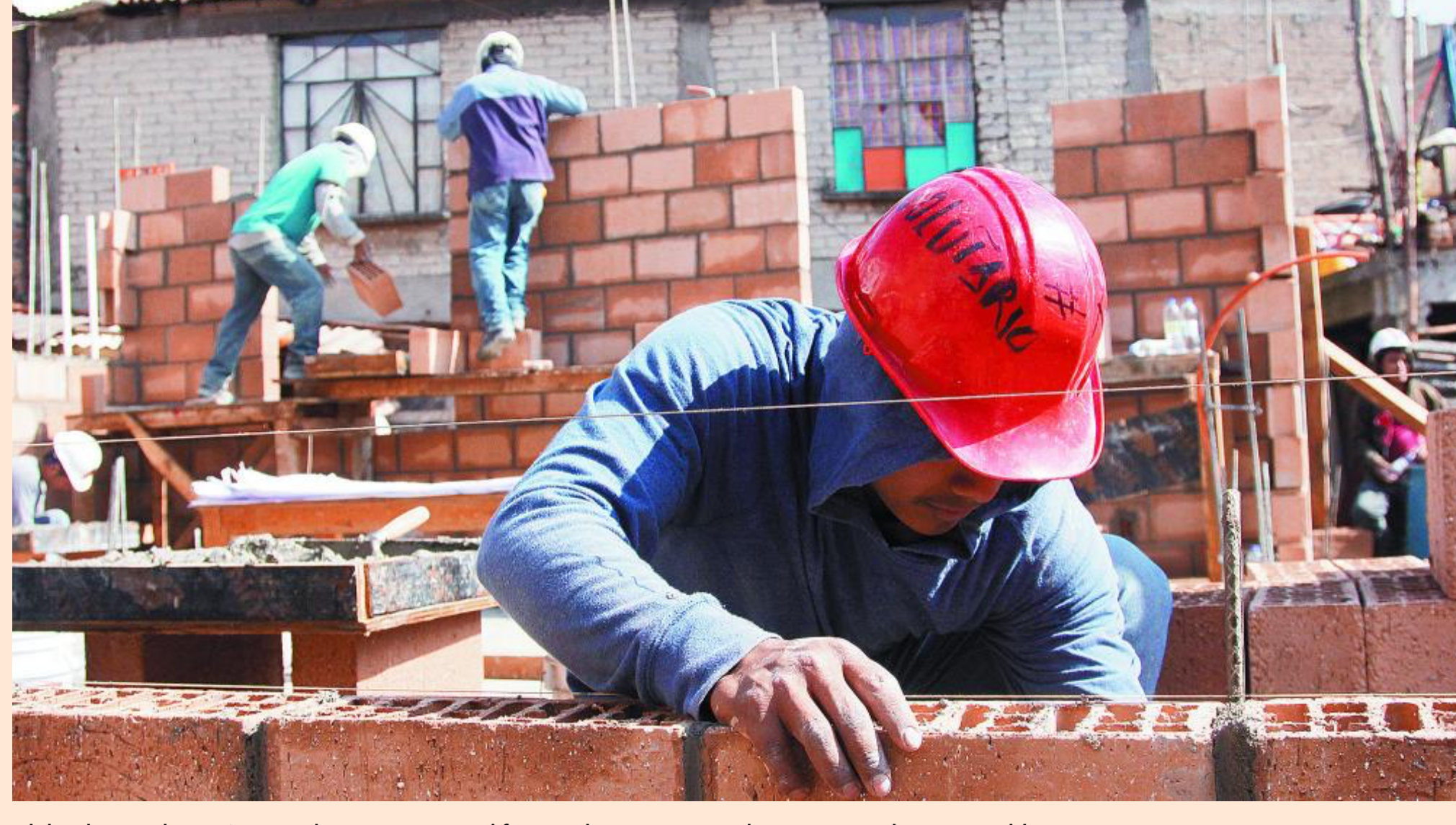
Chihuahua, Jalisco, Aguascalientes y Baja California obtuvieron más de 80 puntos de 100 posibles.

La autoproducción abarca 70% del mercado de construcción habitacional a nivel nacional, según Materiales San Cayetano Express