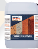
IMPERBARRO® Protección natural