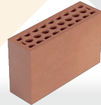
NOVABLOCK 10 Y 12