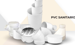
PVC SANITARIO INSTALACIÓN SANITARIA Aplicación: Conducción de aguas sanitarias y pluviales