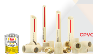
CPVC INSTALACIÓN HIDRÁULICA Aplicación: Conducción de agua fría y caliente (82°C) en casas habitación y edificios de mediana altura.