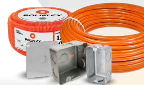
POLIFLEX INSTALACIÓN ELÉCTRICA Aplicación: Proteger los conductores eléctricos del predio