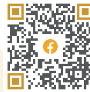
SAN CAYETANO EXPRESS

o puedes visitar nuestro sitio web: WWW.SANCAYETANOEXPRESS.COM.MX