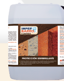
IMPERBARRO® Protección semibrillante