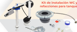
Kit de instalación WC y refacciones para tanque. INSTALACIÓN HIDRÁULICA Aplicación: Kit con todo lo necesario para instalar un WC y refacciones para tanque de WC tradicional.