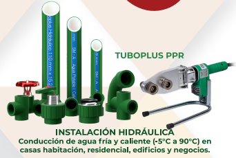
TUBOPLUS PPR INSTALACIÓN HIDRÁULICA Conducción de agua fría y caliente (-5°C a 90°C) en casas habitación, residencial, edificios y negocios.