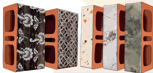
STAMPA by Novaceramic

Para mayor información siguenos en nuestras redes sociales: