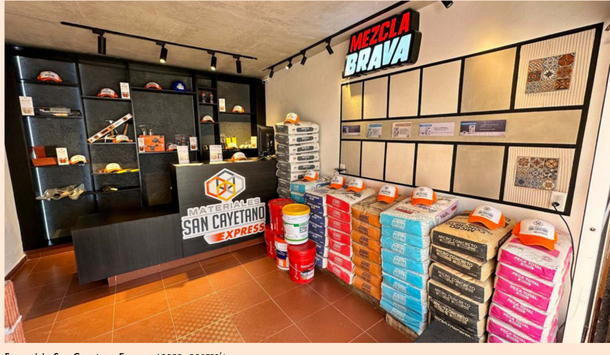
Franquicia San Cayetano Express

Materiales San Cayetano planea llegar a Querétaro, Hidalgo y Morelos con su modelo de tiendas express especializadas